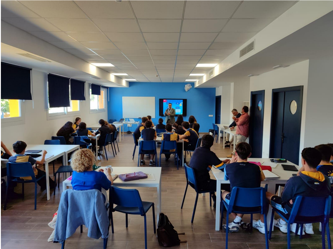
L1 en Novaschool Añoreta