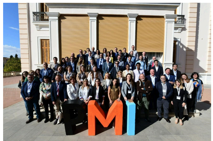
Congreso PMI-A 2022, Granada.