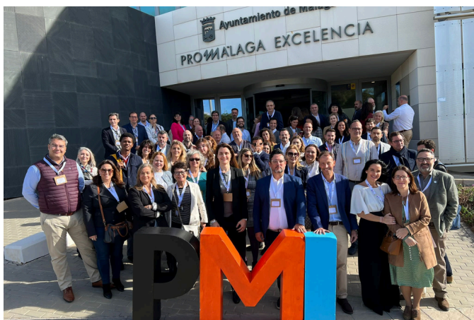
Congreso PMI-A 2023, Málaga.

El Project Management Institute (PMI) es la principal organización internacional que agrupa a los profesionales de la Dirección de Proyectos ( www.pmi.org ), contando con un capítulo propio en Andalucía en el que se encuentran asociados directores de proyectos procedentes de todas las provincias andaluzas ( www.pmiandalucia.org ). Actualmente cuenta con más de 250 socios y casi 2000 profesionales certificados en la región.